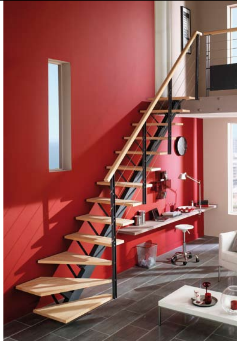
ESCALIER À LIMON CENTRAL ▶ modèle City, Lapeyre

Les escaliers donnent le ton ! Lignes, formes et matériaux impriment sur les intérieurs leur caractère. Avant de sauter le pas, réfléchissez au style que vous souhaitez donner à votre maison. Les variations autour des escaliers sont aussi nombreuses que les effets qu'elles peuvent créer.