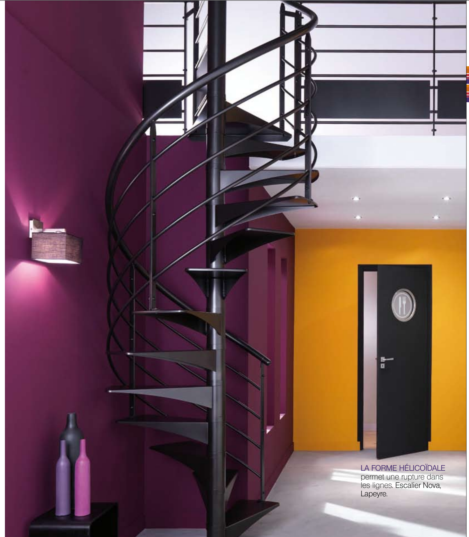
LA FORME HÉLICOÏDALE permet une rupture dans les lignes. Escalier Nova, Lapeyre.