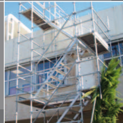
ESCALIER DE CHANTIER 2 ÉTAGES