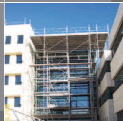
PLATE-FORME DE TRAVAIL 18M