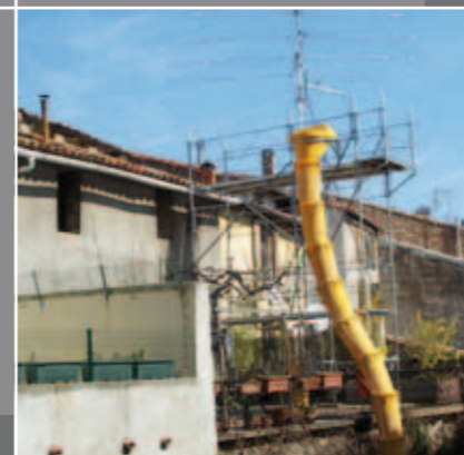
GOULLOTTE SUR PASSERELLE MULTI

Conformité au règlement particulier R096 de la marque NF Échafaudage, au décret du 1er septembre 2004, rapport d'essais réalisé par le CEBTP (Centre Expérimental du Bâtiment et des Travaux Public)