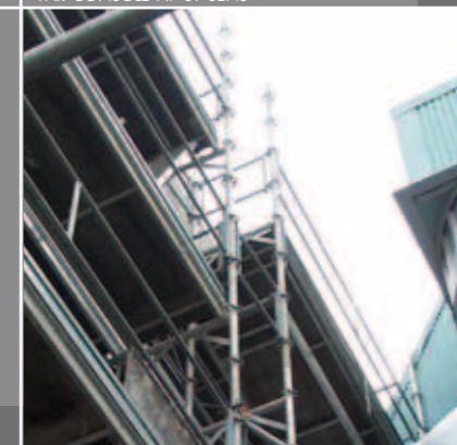
SITE INDUSTRIEL POSE DE BARDAGE