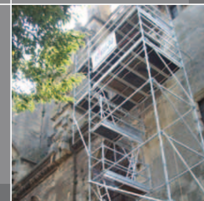
SAPINE ACCES ET LEVAGE