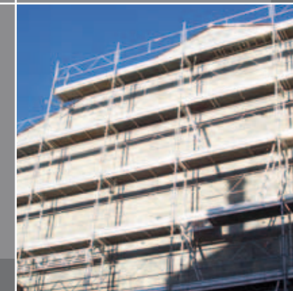
TRAVAUX D'ENDUIT DE FAÇADE