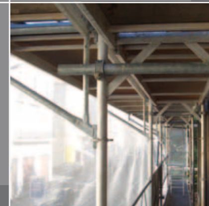
DÉTAIL ANCRAGE ET OPTION COUVREUR PAR CONSOLE AV ST SENS