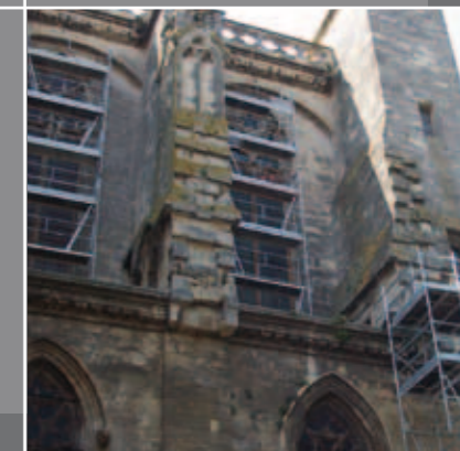
VITRAIL EGISE VILLE DE BEZIERS