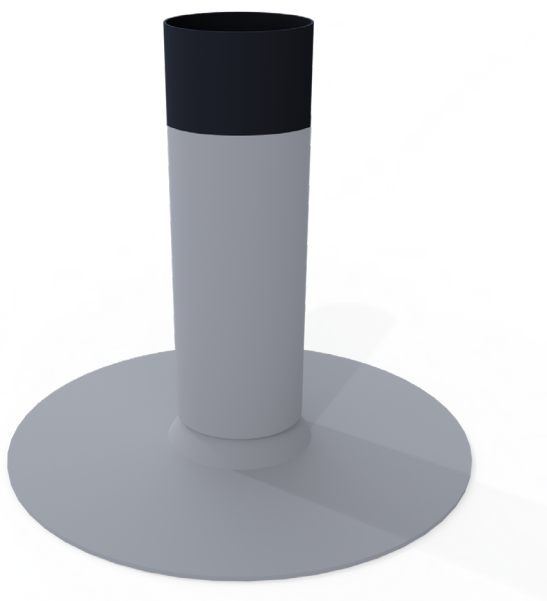
Manchon d'étanchéité pvc