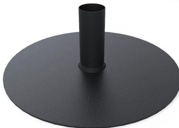
Manchon d'étanchéité bitume