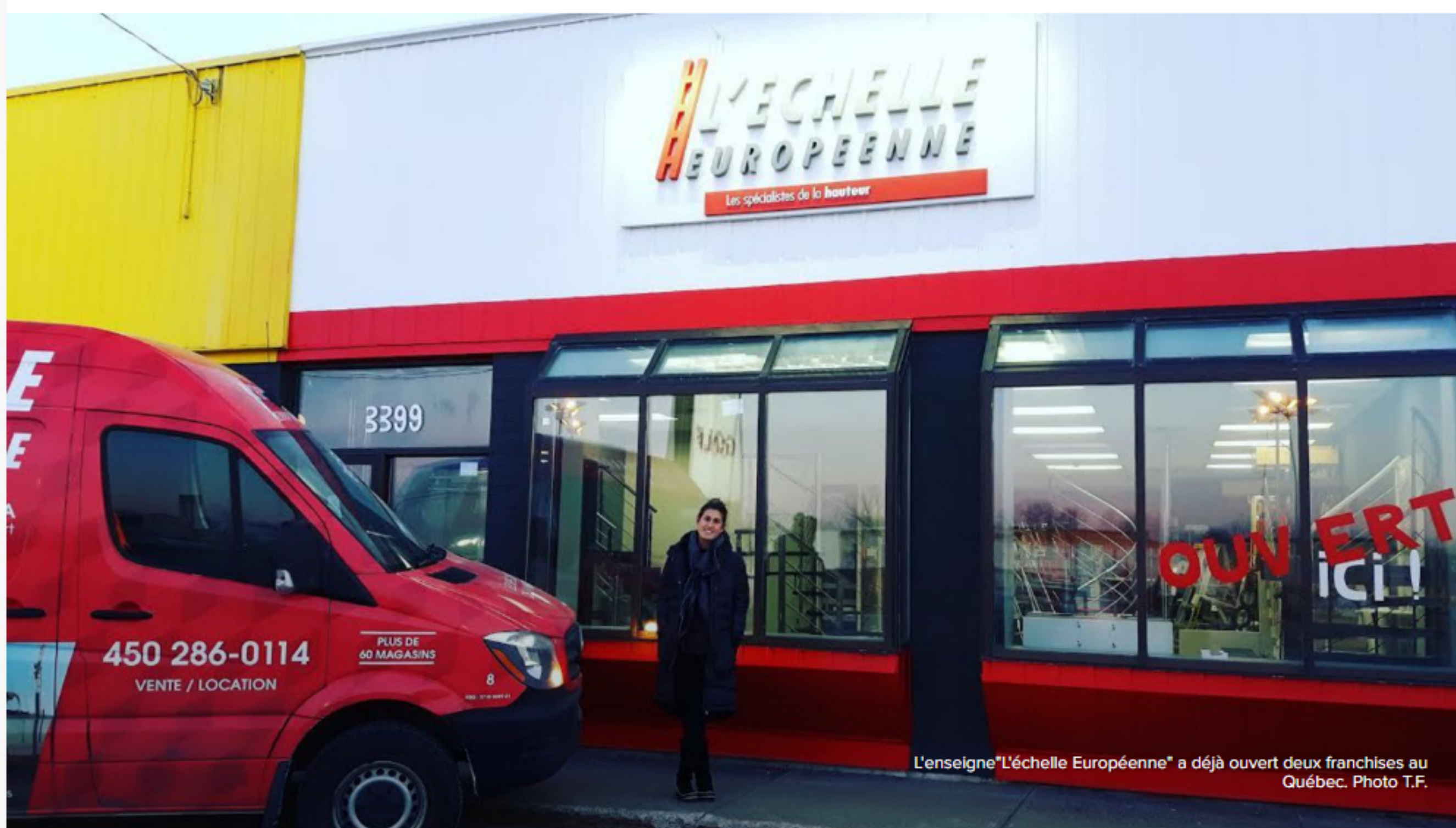
L'enseigne "L'échelle Européenne" a déjà ouvert deux franchises au Québec.

Sur le papier, entreprendre en franchise au Québec est abordable. Mais la démarche demande passion et capacité d'adaptation. Témoignages.